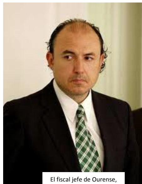
El fiscal jefe de Ourense, Florentino Delgado.

Y el tercer elemento con el que intentó el fiscal justificar su petición de condena por un delito tipificado en el artículo 620.2 del Código Penal por injurias o vejaciones leves, de 15 días de multa a razón de 10€/día para cada uno de los tres policías sindicalistas afectados, más 9.000 euros de indemnización (3.000 por cada uno) como indemnización para el comisario criticado más las costas del proceso, era por la referencia en el escrito a la comisión de un pecado capital por parte del comisario, persona católica y practicante, como un comentario contra sus creencias religiosas. Aquí el fiscal estuvo para descubrirse; tal vez no era su mejor día, estaba de mal humor y se le notaba, primero porque lo que él quería como un juicio por delito se había quedado muy rebajado por las instancias judiciales a las que había recurrido, y segundo porque la