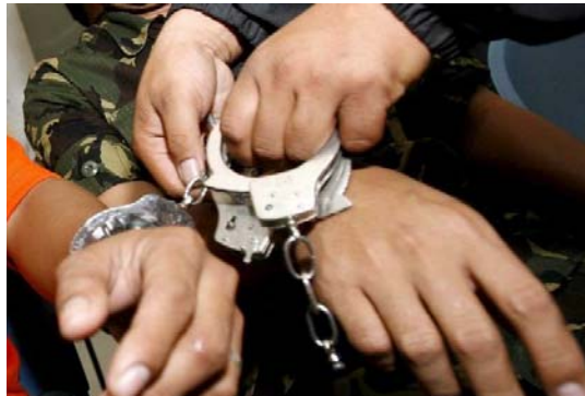
Así están los derechos civiles de los ciudadanos y los derechos sindicales en las fuerzas de seguridad del Estado en España.

Gana tres puntos la Comisión Ejecutiva nacional del SUP por mantenerse firme en sus decisiones a pesar de las presiones y amenazas. El día 7 de julio se constituyó el Consejo de Policía. Los seis vocales (pero que aún así (y más aún en unidad de UFP), decidieron no asistir al acto, por las irregularidades cometidas durante el proceso electoral y por la falta de palabra del director general de la Policía y la Guardia Civil. Los 3 vocales de UFP asistieron, expusieron sus razones y quedaron abandonados, y quedaron dentro los vocales de SPP y CEP.