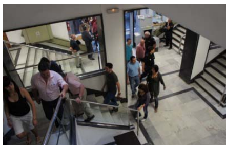
Algunos asistentes entrando al juzgado

La segunda razón utilizada por el fiscal para exigir la condena fue que el escrito decía que se consideraba un comportamiento cobarde lo que hizo el comisario de Ourense, al aconsejar-ordenar la comunicación de la presunta infracción sin hacer indagaciones ni preocuparse por conocer las razones que habían llevado a los dos policías a actuar como lo hicieron. El comisario no debe haber realizado muchos servicios en la calle y se siente desestabilizado porque le dicen que ha actuado